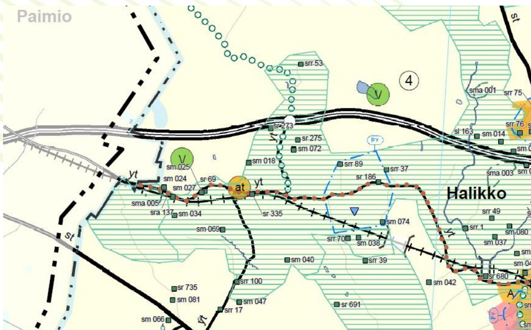
Ote Salon seudun maakuntakaavasta

Maakuntakaavaan voi tutustua tarkemmin Varsinais-Suomen liiton sivuilla osoitteessa http://www.varsinais-suomi.fi/images/tiedostot/Maankaytto/2010/kaavoitus/Salo/ssmk_20081112_vahvistettu.pdf