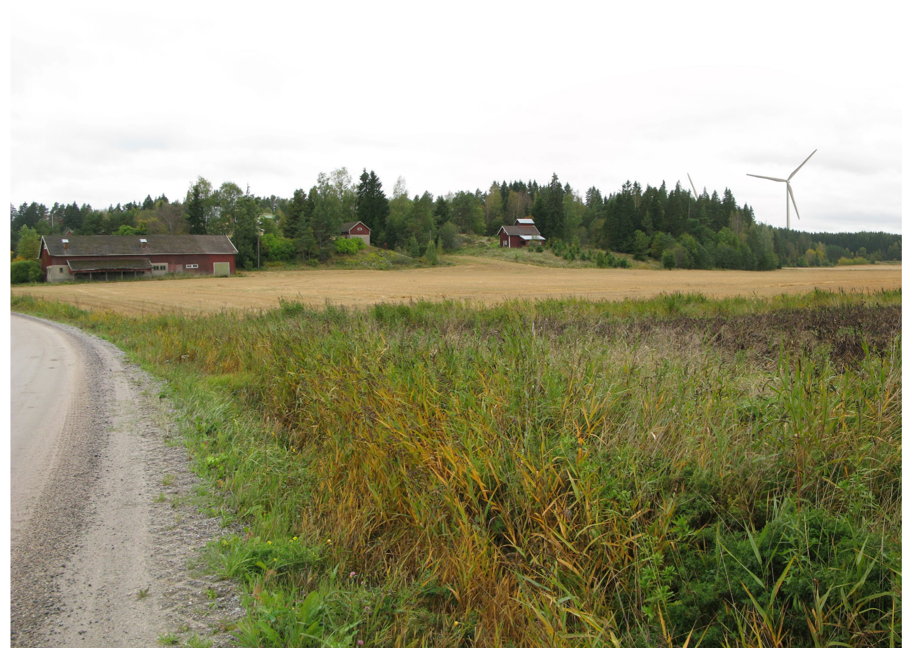
Kuvauspiste 3. Näkymä Sauvontieltä kohti Pöylän kylää.