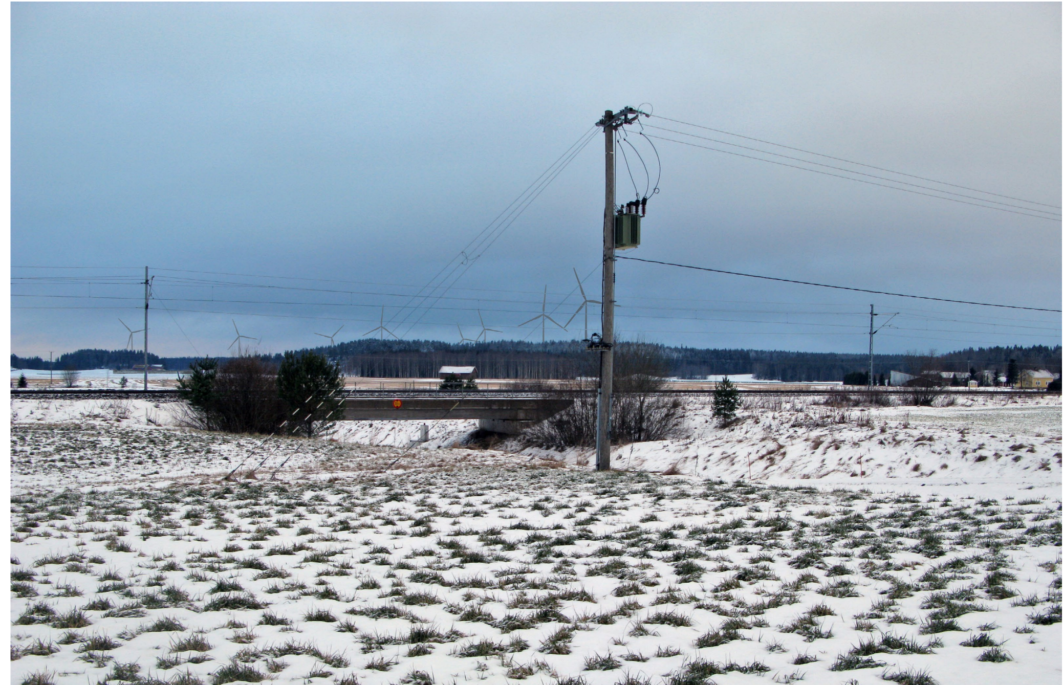
Kuvauspiste 8. Kuva on otettu Pitkänportaan maisemista, Vanhalta Turuntieltä Yötilöntien alikulun kohdalta kohti kaava-aluetta.