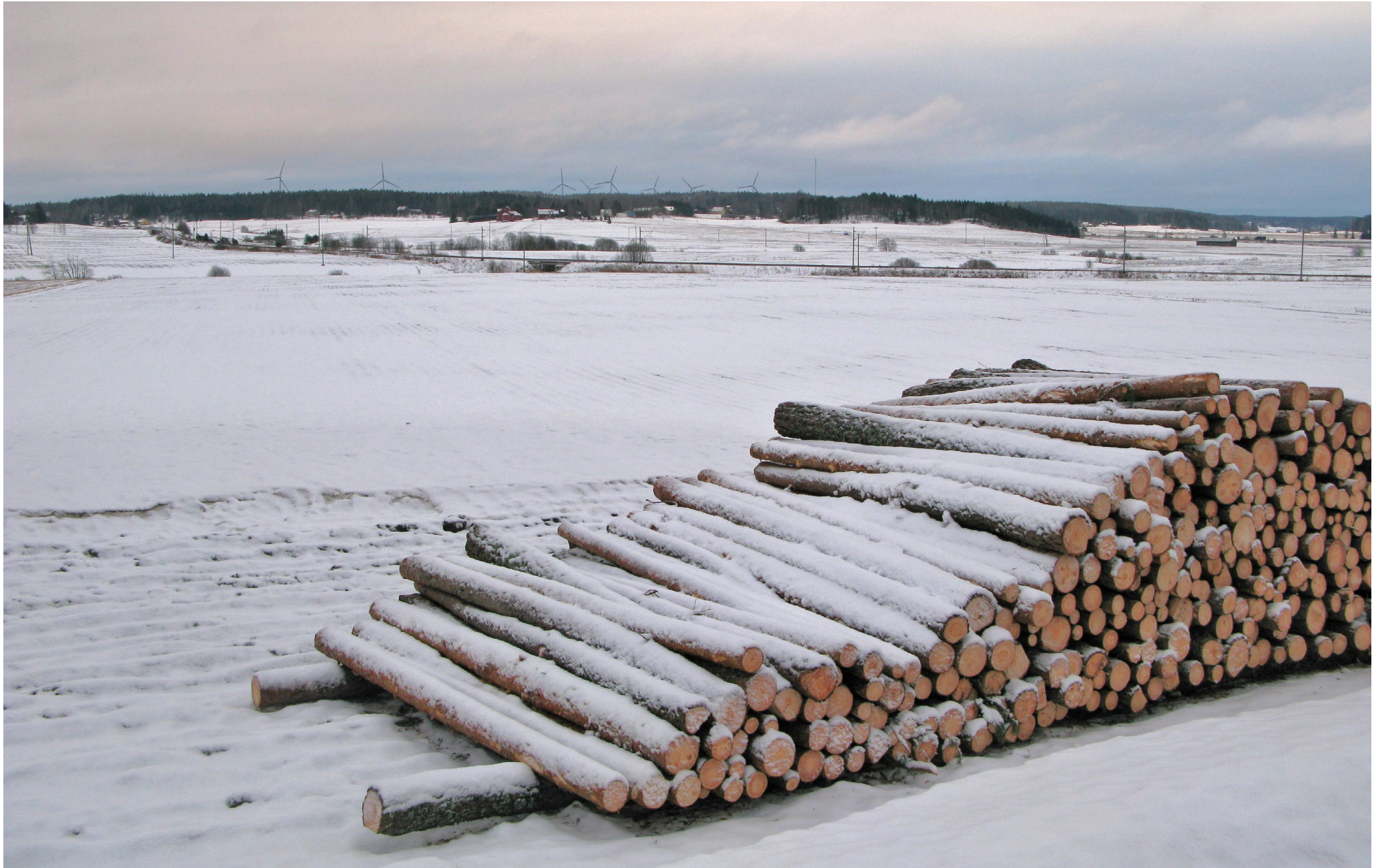
Kuvauspiste 9. Kuva on otettu Turku-Helsinki moottoritien ja rautatien pohjoispuolelta Iso-Heikoisentieltä.