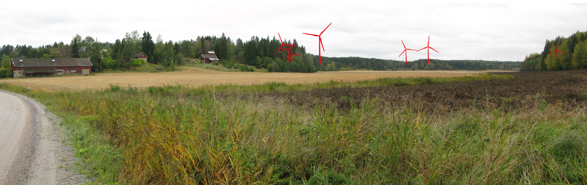
Kuvauspiste 3. Panoraamanäkymä Sauvontieltä kohti Pöylän kylää. Alemmassa kuvassa voimalat esitetty korostevärein.