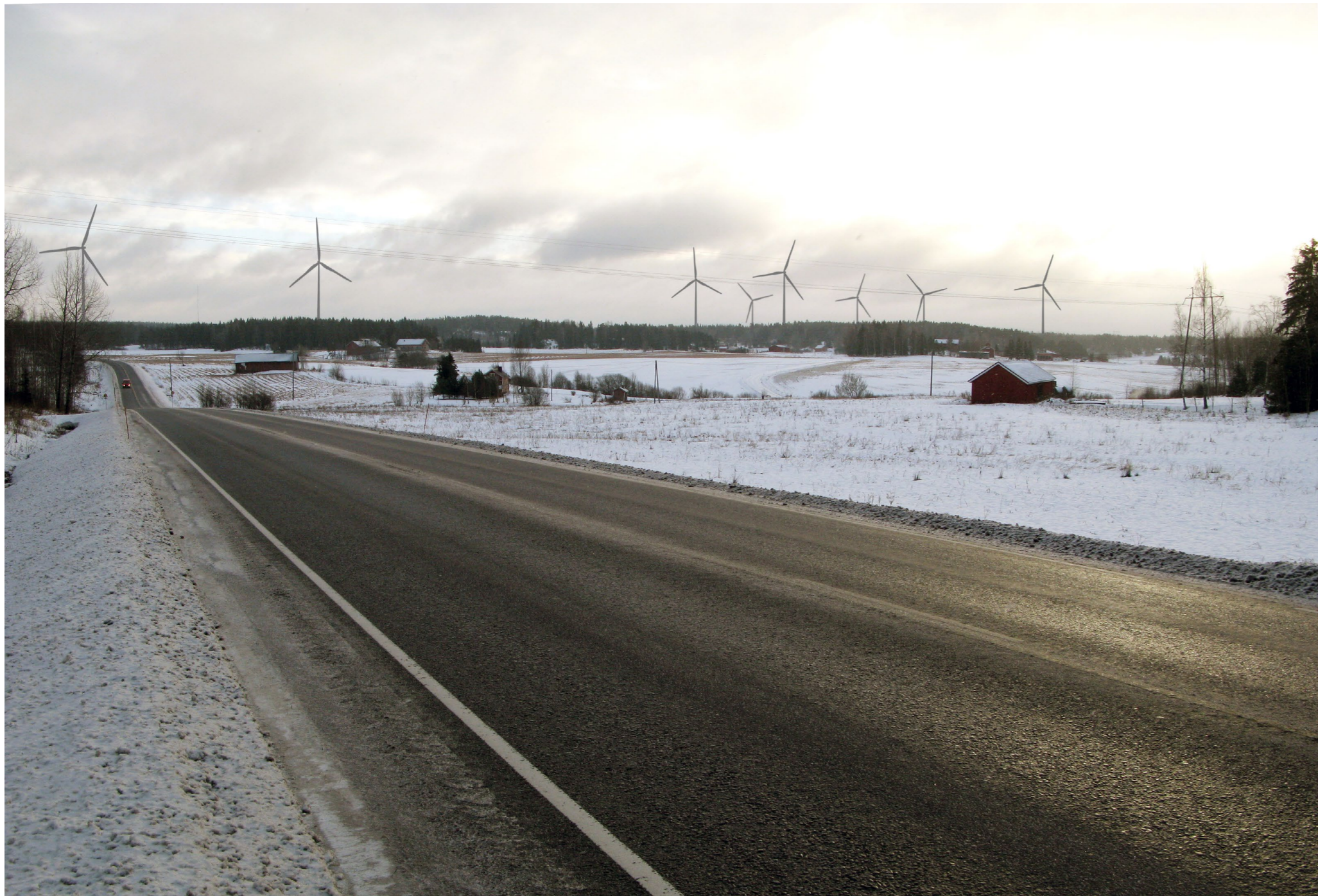
Kuvauspiste 7. Näkymä valtatie 110 ja Kurjentien risteuksen kohdalta kohti kaava-aluetta. Havainnekuvasssa näkyvät kaikki kahdeksan voimalaa.