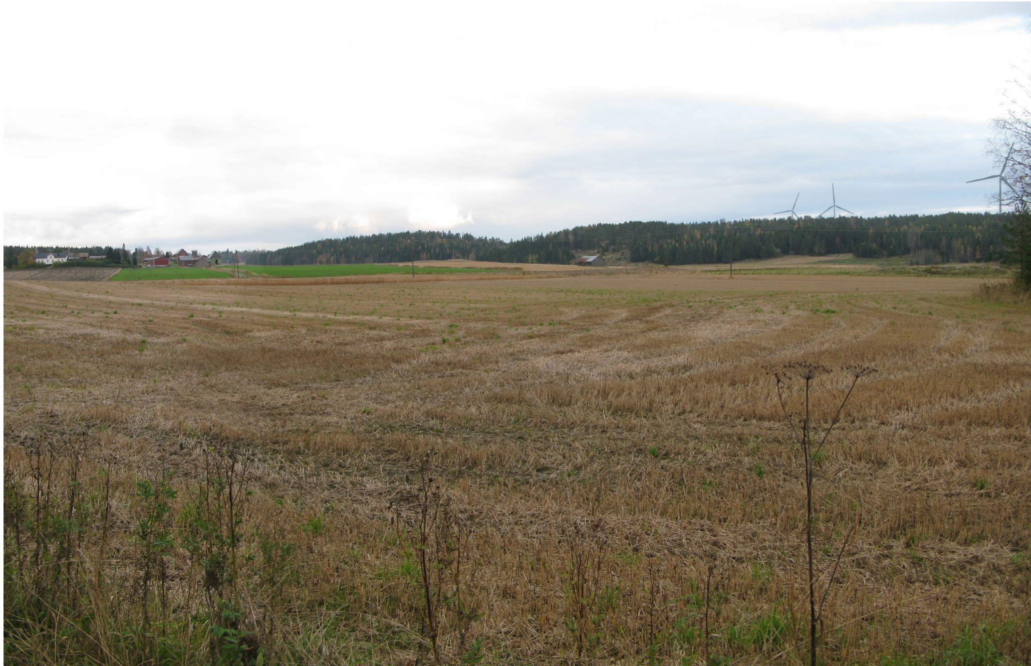
Kuvauspiste 5. Näkymä Nummistenttieltä kohti Huson kulttuurimaisemaa. Huson kylä vasemmalla.