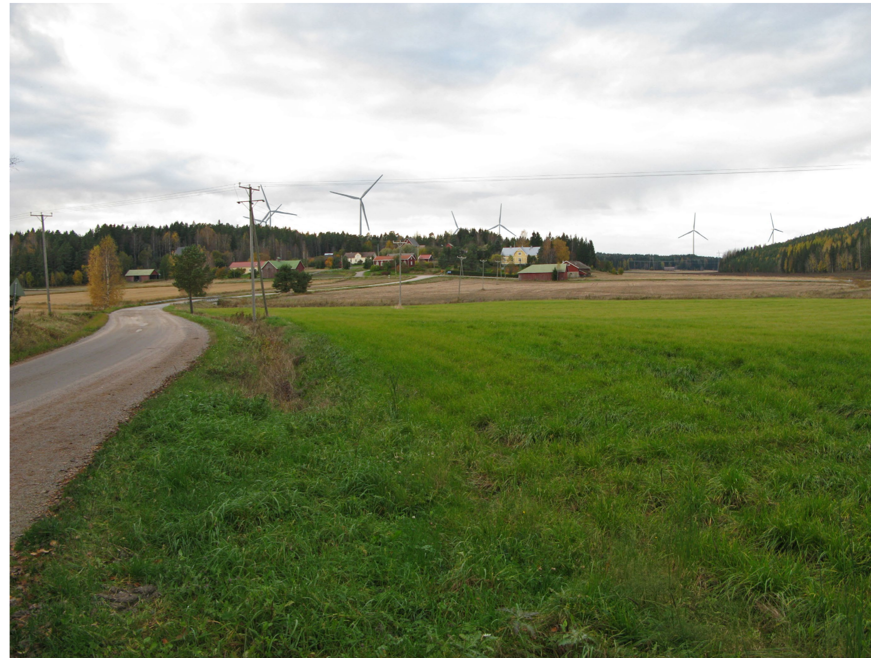
Kuvauspiste 1. Näkymä Pöyläntieltä kohti Pöylän kylää. Kuvan oikeassa reunassa Pöylän Linnavuori.

7 Valokuvasovitteessa käytetyn valokuvan ottopaikka ja numero