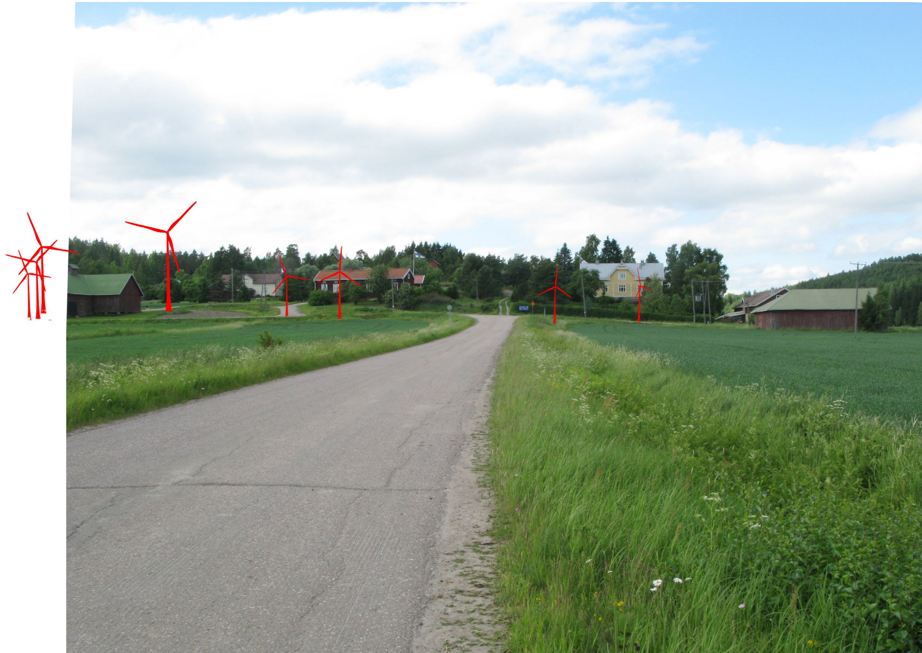
Kuvauspiste 2. Näkymä Pöyläntieltä Vainionjoen ylityksen jälkeen kohtisuoraan Pöylän kylän suuntaan. Voimalat esitetty korostevärein. Kuvaussektorin ulkopuolelle jääneet voimalat on tuotu kuvaan havainnollistamisessa käytetystä virtuaalimallista.