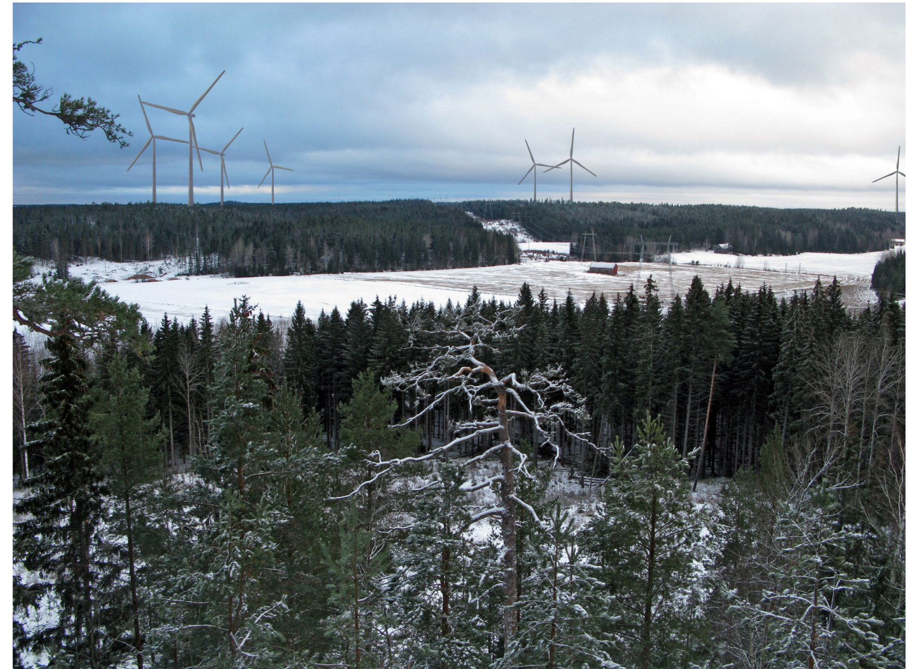
Kuvauspiste 4. Kuvan vasemmassa reunasta toisena näkyy eteläisin voimala. Valtatietä 110 lähimmäksi sijoittuva pohjoisin tuulivoimala jää kuvan ulkopuolelle.