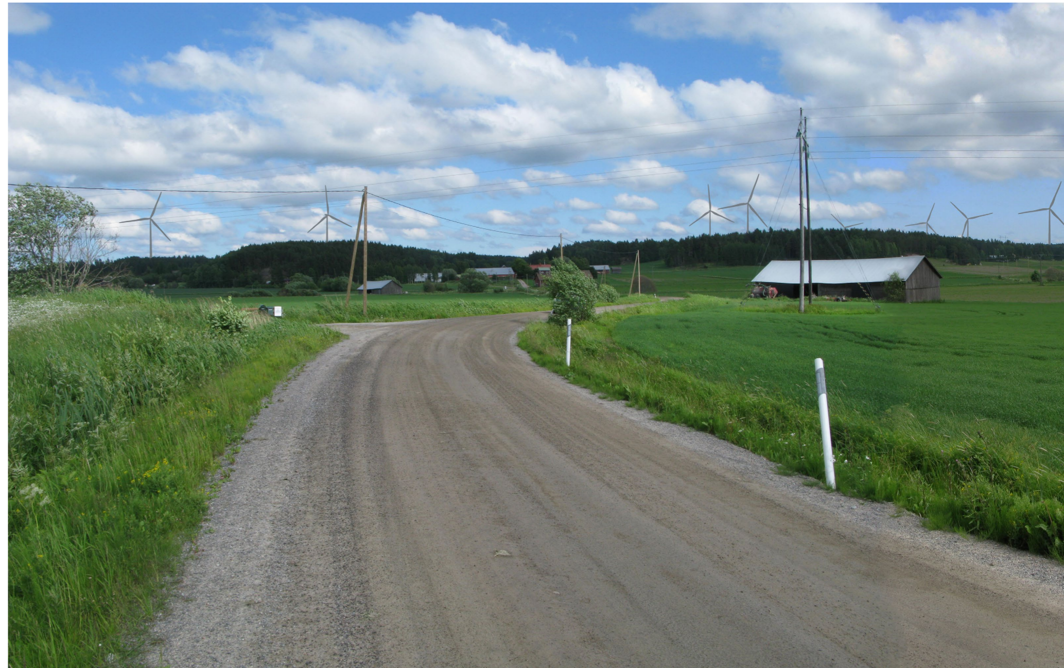
Kuvauspiste 6. Kuva on otettu Kurjentieltä kohti kaava-aluetta. Havainnekuvassa näkyvät kaikki kahdeksan voimalaa.