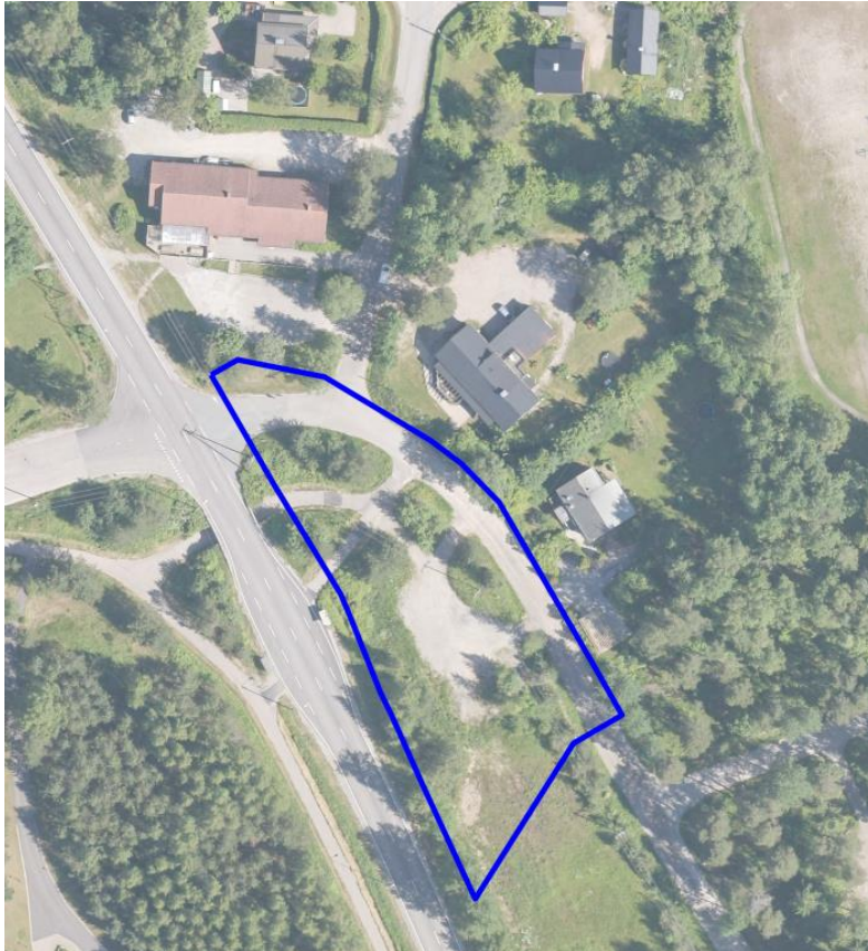
Suunnittelualue ympäristöineen. Ilmakuva © Blom 2015.

Suunnittelualue on kooltaan 3 979 m 2 . Se sijaitsee Märynummen taajamassa Vaskiontien ja Opinahjontien risteyksen tuntumassa. Suunnittelualueelta on matkaa Halikon kirkokylään noin viisi kilometriä ja Salon keskustaajamaan noin 8,5 kilometriä. Suunnittelualue on pääosin Salon kaupungin omistamaa. Valtio omistaa maantien alueen ja yksityinen maanomistaja suunnittelualueen pohjoisnurkan. Suunnittelualueen ja lähiympäristön maanomistus käy ilmi liitteestä 2.