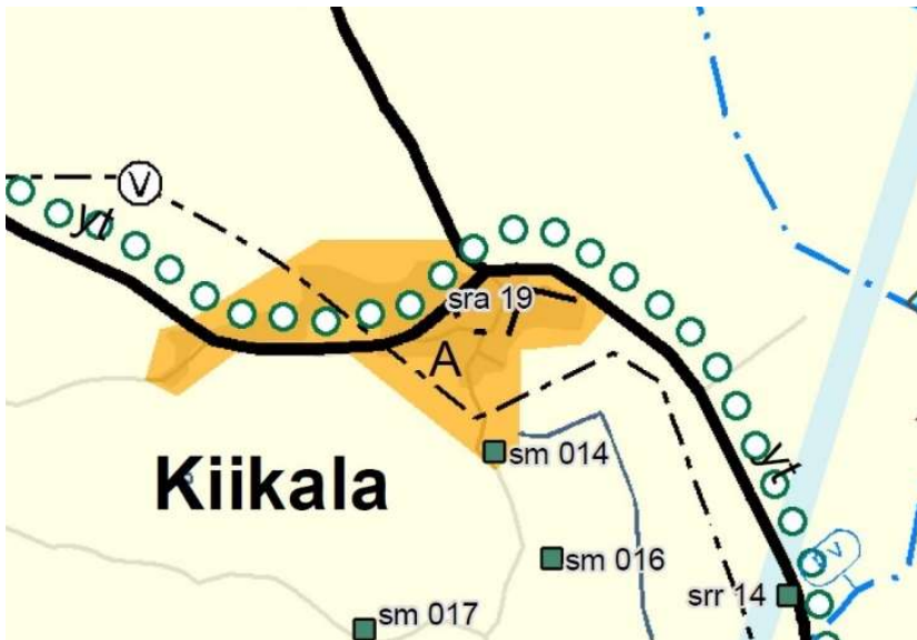
Ote Salon seudun maakuntakaavasta.

Salon seudun maakuntakaava on vahvistettu 12.11.2008. Maakuntakaavassa suunnittelualue on taajamatoimintojen aluetta (A). Merkinnällä osoitetaan valtakunnallisesti, maakunnallisesti tai seudullisesti merkittävät asumisen ja muiden taajamatoimintojen alueet. Sisältää asuinalueiden lisäksi paikallisia palvelukeskuksia, työpaikka-alueita ja ympäristöhäiriöitä aiheuttamattomia, pienehköjä teollisuusalueita sekä seututeitä pienempiä liikenneväyliä, lähivirkistysalueita sekä erityisalueita.