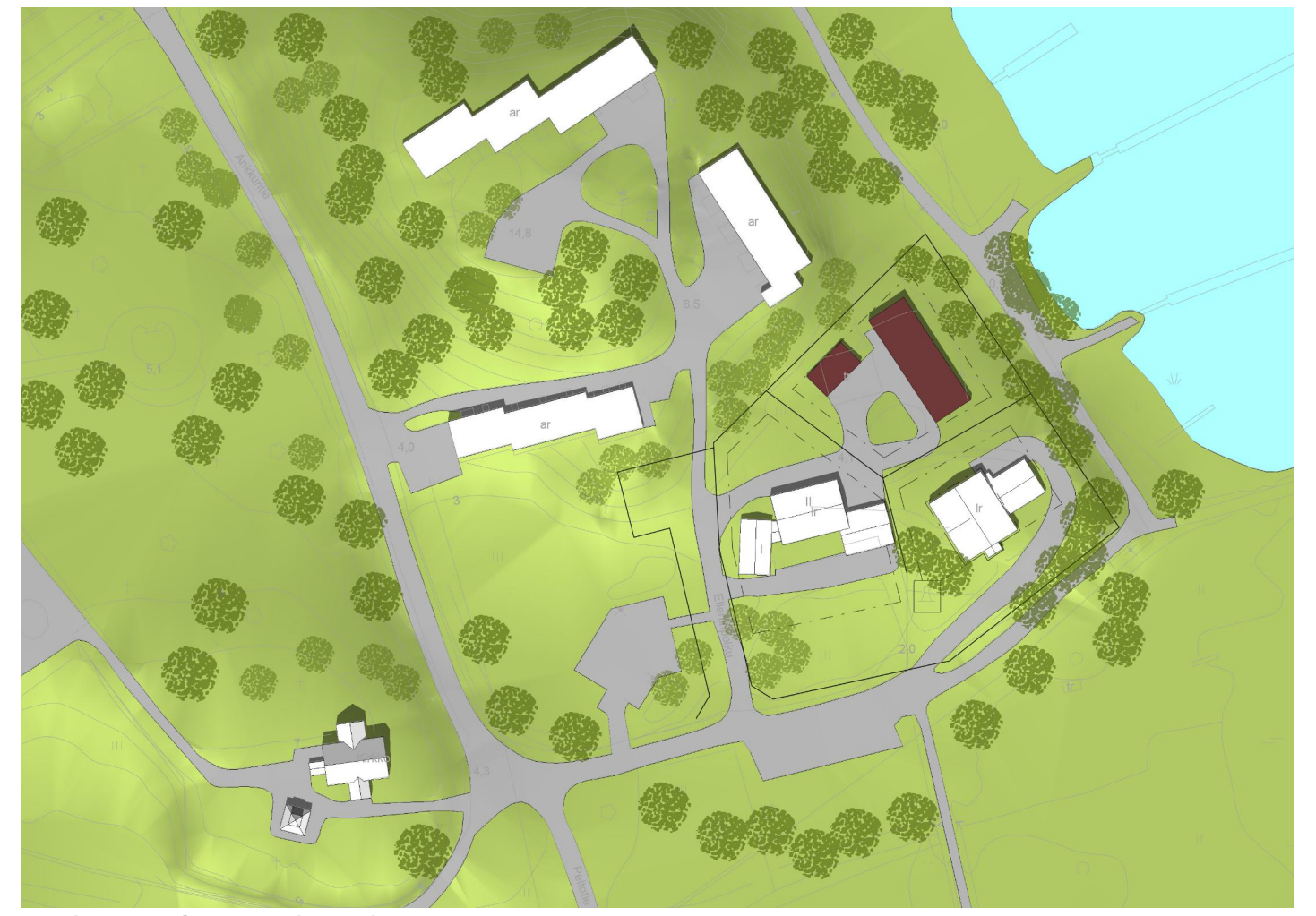
Havainnekuva © Kaupunkisuunnittelu