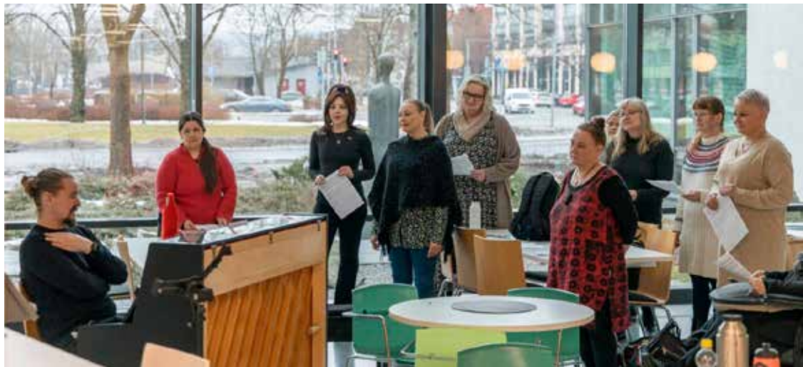
Minussako luonnikas laulaja -tapahtuma toteutettiin osallistuvan budjetoinnin rahoituksella kahteen kertaan Salon Viihdelaulajat ry:n toimesta. Jälkimmäinen tilaisuus pidettiin kaupungintalolla 25. helmikuuta 2024.

Hankkeille ei vaadittu omarahoitusosuutta, mutta joissain hankkeissa oman rahoituksen osuus on merkittävä ja joidenkin osalta vielä epävarma. Yhdelle toteutukselle voidaan myöntää enintään 10 000 euron määräraha.