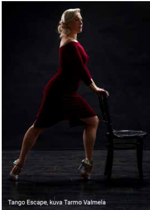
Tango Escape, kuva Tarmo Valmela