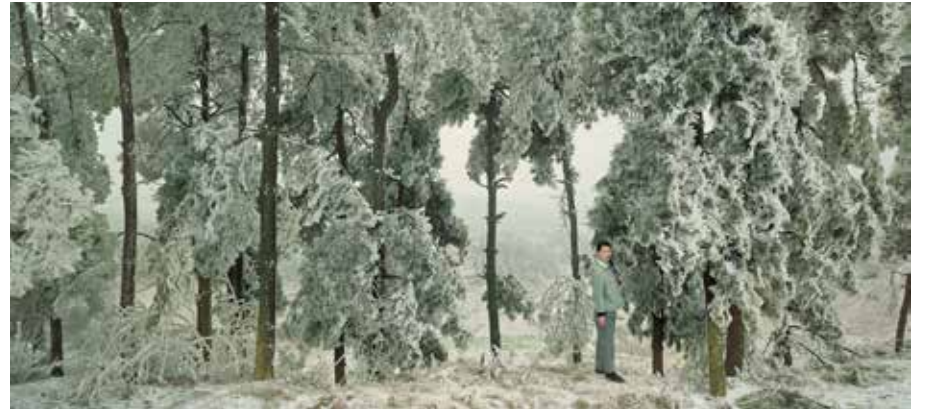
Chen Jiagang, The Cold Forest, 2008, yksityiskohta.

Ilmoittautuminen ja tarkemmat ohjeet, katso Salon kansalaisopisto.