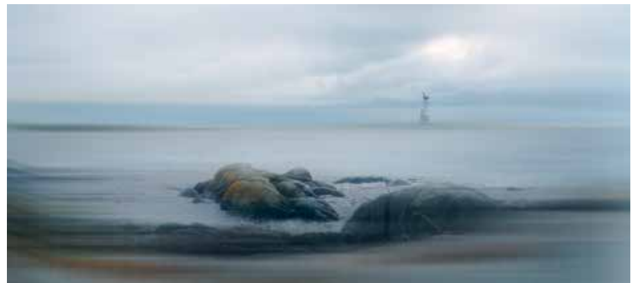
Nuutti Koskinen, Primaarisuknessio, 2023/2024, yksityiskohta.

Chongqingissä 1962 syntynyt Chen Jiagang kouluttautui alun perin arkkitehdiksi. Vuodesta 1999 lähtien Chen on tullut tunnetuksi valokuvaajana sekä yksityis- että ryhmänäyttelyissä eri puolilla maailmaa, kuten Aasiassa, Euroopassa sekä Yhdysvalloissa. Chen Jiagang asuu ja työskentelee tällä hetkellä Pekingissä.