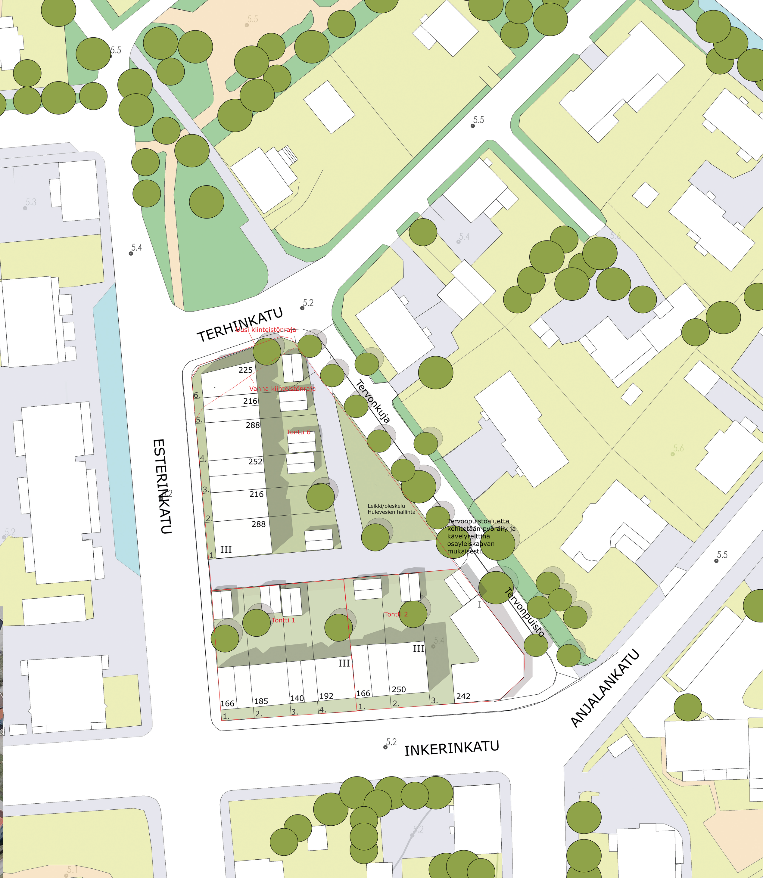
Asemapiirros luonnos 1:500 @Salon kaupunki