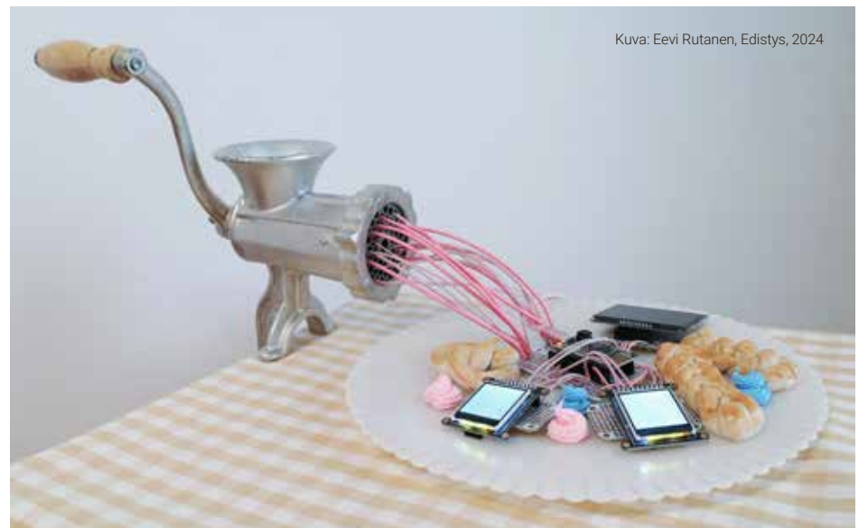
Kuva: Eevi Rutanen, Edistys, 2024

Kansainvälisen taiteilijan tärkeitä tukikohtia ovat olleet niin Helsinki, Tammela, New York kuin Tukholma ja kesällä 2024 myös Salo. Suomessa Rantasen töitä ei ole ollut esillä näin laajasti kymmeneen vuoteen. Veturitallissa nähdään uusimpia, viimeisten vuosien aikana valmistuneita maalauksia sekä grafiikkaa.