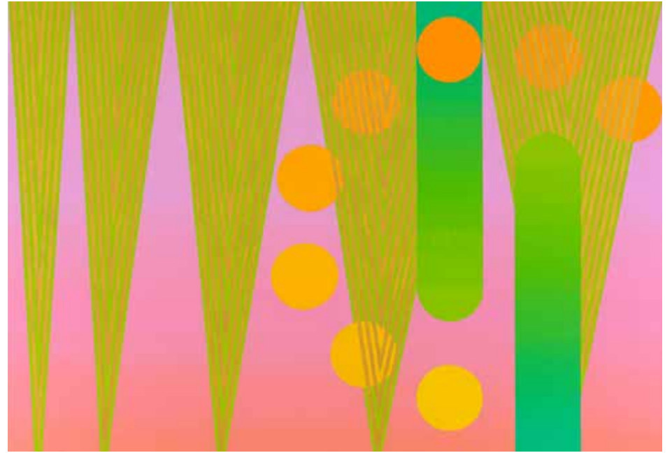
Kuva: Mari Rantanen, Good Vibrations #3, 2022, yksityiskohta.