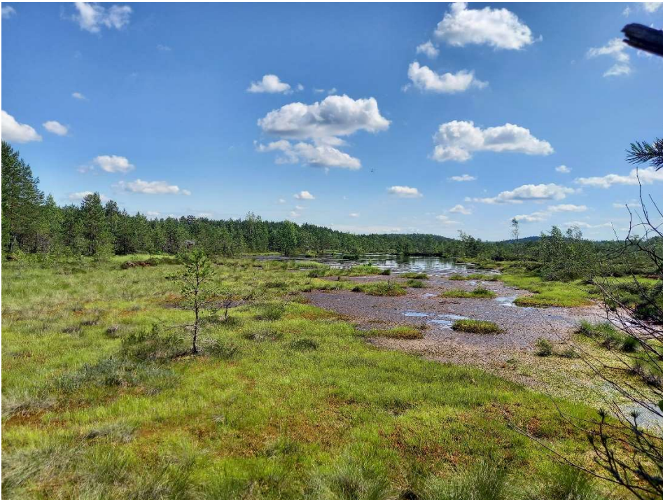
Kuva: Nairassuo Kiskossa

Ympäristönsuojelussa suunnitelmallisen valvonnan toteuttaminen on ollut hyvällä tasolla (93 %). Haja-asutusten jätevesien käsittelyn valvontaa ei sen sijaan ole pystytty tekemään tehokkaasti resurssipulan vuoksi.