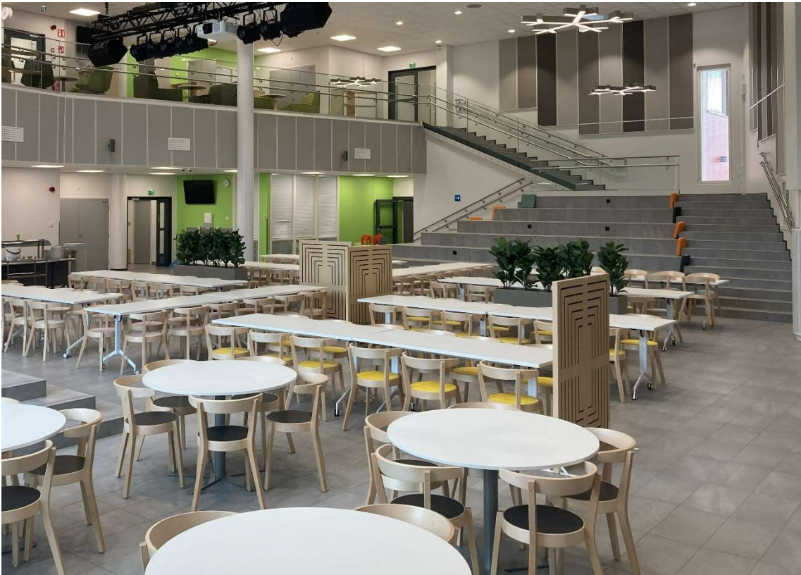
Kuva: Perniön Kirkonkylän koulun keskeistila