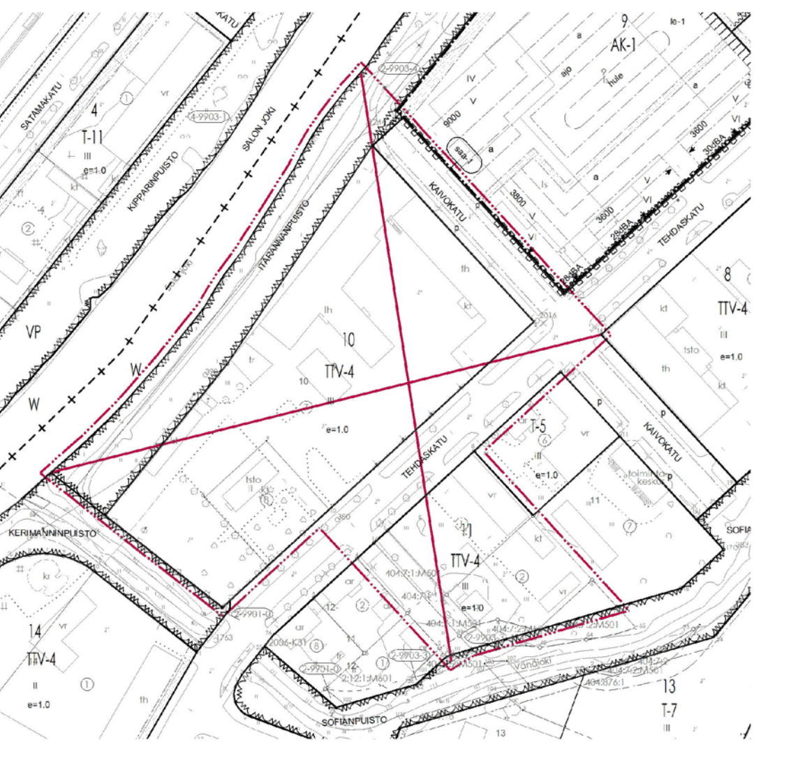
Poistuva kaava © Salon kaupunki, ei mittakaavassa.