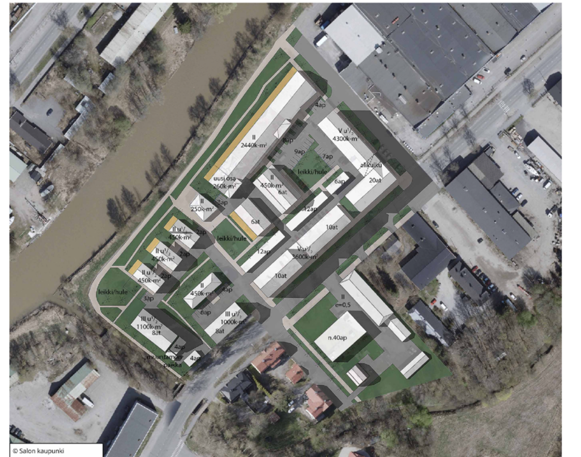
Havainnekuva, ei mittakaavassa.