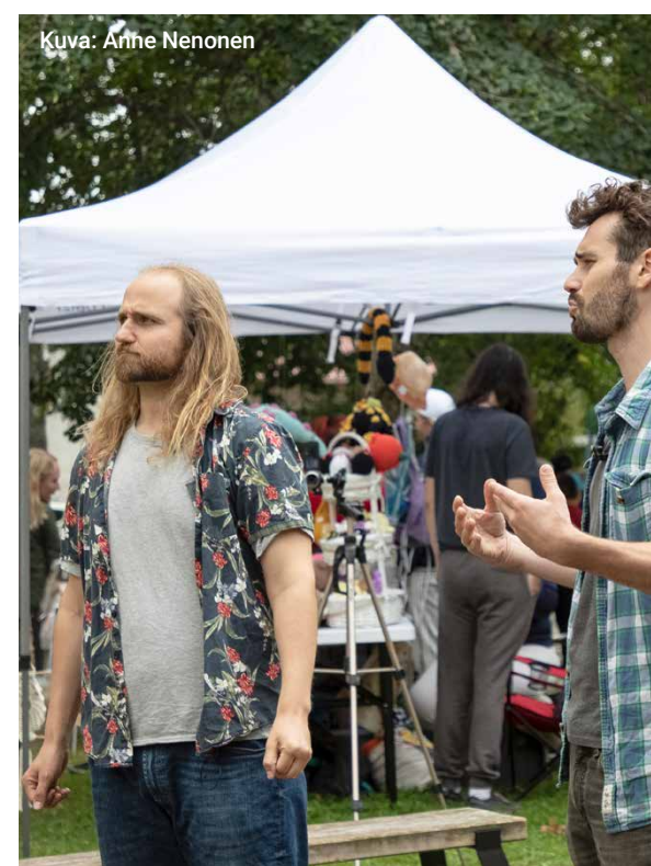
Salon kulttuuripalvelut tukee paikallisten yhdistysten toimintaa ja tapahtumia eri tavoin – kuvassa Muurlan Wanhajan markkinat ja Kesä yhdessä -kiertueitaillat Repe ja Kemia.

Kulttuuriavustusten avulla tuetaan luovaa ja taiteellista työtä, rikastutetaan kulttuuritarjontaa, vahvis-