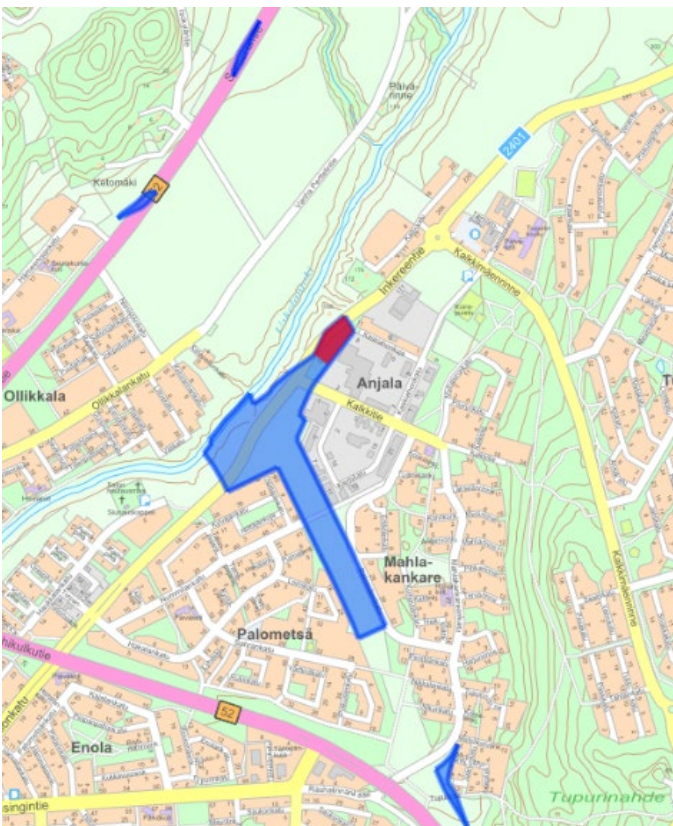
Suunnittelualue kartalla. © Salon kaupunki.

Suunnittelualue koostuu neljästä erillisestä osa-alueesta. Kaksi pienintä suunnittelualueen osaa sijaitsevat Somerontien varressa. Keskeisin ja kooltaan suurin osa-alue sijoittuu Inkereentien ja suunnitellun itäisen ohikulkutien (kt 52, 2.vaihe) risteysalueelle ja sen lähiympäristöön. Eteläisin suunnittelualueen osa sijaitsee Mahlakankareentien ja Tupurintien välissä. Suunnittelualue oli laatimisvaiheessa noin 15,9 hehtaaria. Ehdotusvaiheessa keskimmäistä osa-aluetta laajennettiin lausuntopalautteen vuoksi. Tämän jälkeen suunnittelualue on kokonaisuudessaan noin 16,9 hehtaaria. Laajennusalue kuvassa punaisella värillä.