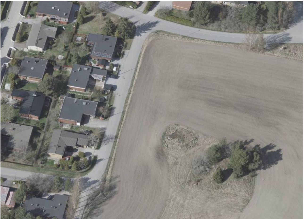
Viistoilmakuva etelästä. Mapspace. 2023.

Suunnittelualue on pääosin viljelysmaata. Alueen itälaidalla pieni osa avokalliota. Alueen länsilaidan välittömässä läheisyydessä on syvä oja ja kadun toisella puolella on yksikerroksisia tiiviisti rakennettuja erillispientaloja. Pohjoislaidalla on väljemmin rinteeseen sommiteltuja yksikerroksisia erillispientaloja. Alueen itä- ja etelälaidalla on loivasti länteen viettävää viljelysmaata.