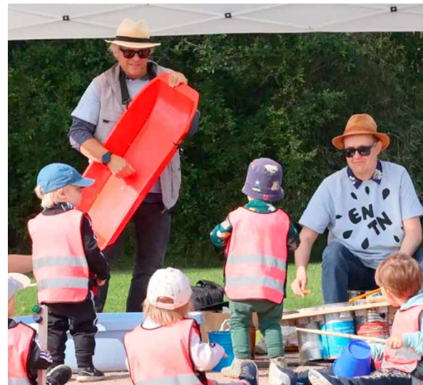
SUPER teatteri kierrätyssoitinmuusikot.