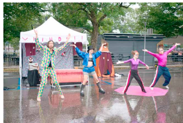
Blind Gut Company: Viihdy! Viihdy! Viihdy!

Läntinen tanssin aluekeskus / Kesäkulkurit Kesäkulkurit ovat valmiina tempaamaan sinut tanssin maailmaan. Mukana 13.6. Avoimissa kylissä Vartsalassa, Suomensjärvellä ja Hajalassa.